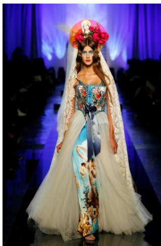
Figura 5. Les Vierges collection, Apparitions dress, Haute couture spring/summer 2007, Disponible en https://dmaeducatorblog.files.wordpress.com/2011/11/gautier_jpg_01502.jpg copyright© P. Stable/Jean Paul Gaultier.

En un segundo caso, el llamamiento mediático producido ante la idea de romper con las estructuras tradicionales del uso de la imagen religiosa son las que motivan el ejercicio creativo del diseñador. En este sentido, no solamente se utiliza la estética religiosa con el fin de enriquecer el producto, sino que este es llevado al punto de la transgresión de su uso. Un buen ejemplo lo constituye la propuesta Les Vierges o “ Madonnas ” (Figura.5) presentada en 2007 por el diseñador francés Jean Paul Gaultier, una colección que contraviene el uso de la imagen mariana connotada de cualidades como la pureza, la castidad y el recato para transformarla en una mujer llena de vida y sensualidad.