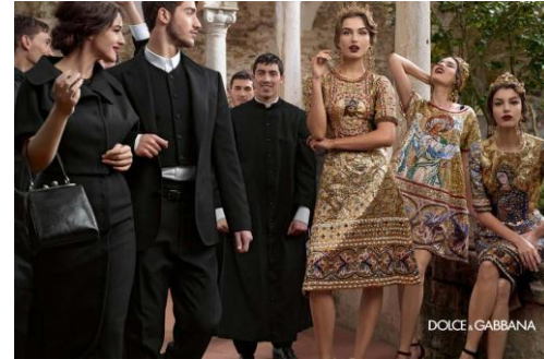
Figura 4. Dolce & Gabbana. Campaing Colección Otoño /Invierno 2013-2014 Catholic Church

En un segundo caso, el llamamiento mediático producido ante la idea de romper con las estructuras tradicionales del uso de la imagen religiosa son las que motivan el ejercicio creativo del diseñador. En este sentido, no solamente se utiliza la estética religiosa con el fin de enriquecer el producto, sino que este es llevado al punto de la transgresión de su uso. Un buen ejemplo lo constituye la propuesta Les Vierges o “ Madonnas ” (Figura.5) presentada en 2007 por el diseñador francés Jean Paul Gaultier, una colección que contraviene el uso de la imagen mariana connotada de cualidades como la pureza, la castidad y el recato para transformarla en una mujer llena de vida y sensualidad.