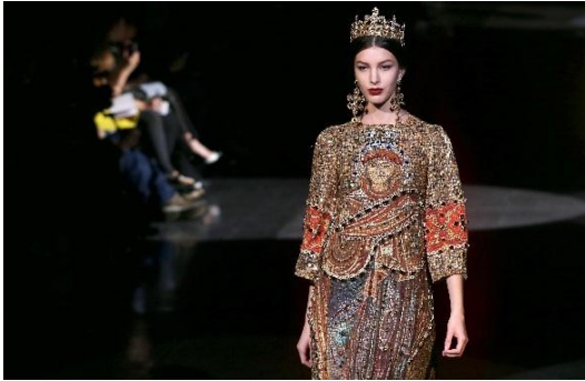
Figura 3. Dolce & Gabbana. Colección Otoño /Invierno 2013-2014 Catholic Church

enriquecer unas líneas básicas en cuanto a silueta se refiere. Esta apuesta apropia este tipo de acabado tradicional en la arquitectura romana el cual es transformado en estampados que son enriquecidos con apliques de pedrería.