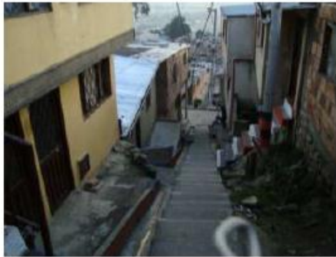
Figuras 3,4,5 y 6. Análisis Barrio El codito. Estudiante Gabriel Henao. 2011