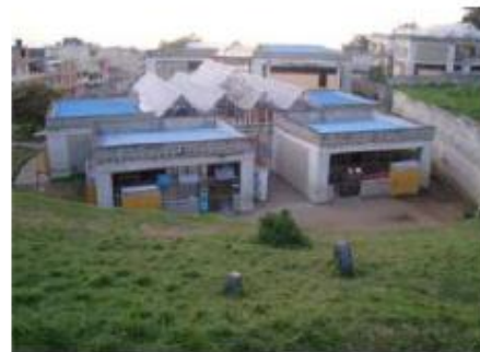
Figuras 8,9,10 y 11. Estudiante Gabriel Henao. 2011.