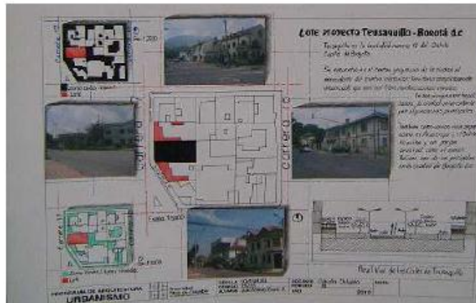
Figura 12. Análisis Teusaquillo. Estudiante Juan Manuel Siado. 2010.

Una vez analizado el sector y sus características, se crean propuestas arquitectónicas y sociales que buscan mejorar las condiciones del sector y sus habitantes. ( Figuras 12 y 13).