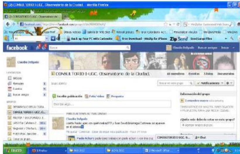
Figura 14. Página Facebook CONSULTORIO I-OBSERVATORIO DE LA CIUDAD. 2012.