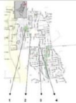
Fig. 7. Gabriel Henao 2011.