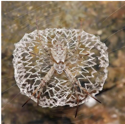
Figura 1 araña tejedora de orbe y su Característica red.

Inspirándonos en la araña tejedora de orbe se abstraio elementos y formas que contienen este artrópodo, no solo sus formas más características, su físico, sino también el nombre que lleva esta.